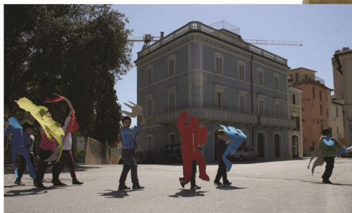
Installazione in P.zza Mazzini in occasione della manifestazione Attraversamenti 07. Biennale Diffusa di Grafica