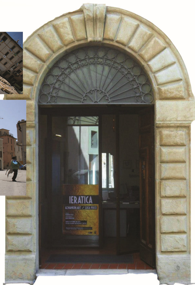
Ingresso di Palazzo Lucarini