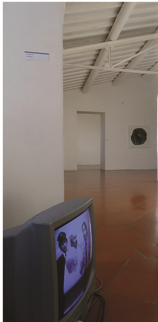
Scorcio di due sale del museo in occasione della mostra Arte Natura Spazio Urbano (nov 2012)